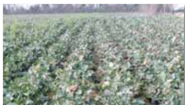
Colza au 21 novembre biné fin septembre

* Exemples d'itinéraires issus des enquêtes réalisées en Bretagne par le réseau cuma en 2011