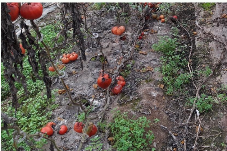
Légende : l'Herbi'Chanvre en fin de culture début novembre, après 7 mois en place, à un stade avancé de décomposition.