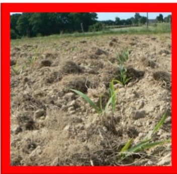
Effet des résidus mal dégradés lors du passage d'outils mécaniques