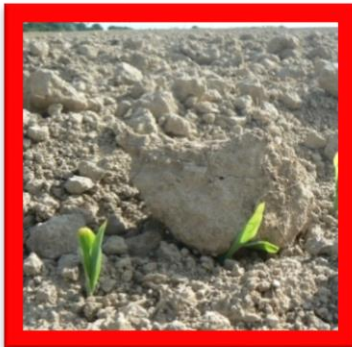
Effet des mottes de trop grande taille lors du passage d'outils mécaniques